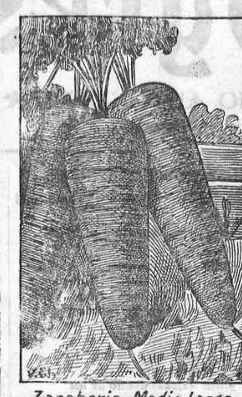
Zanahoria Medio Larga

Méndez Núñez, No. 16—Santa Cruz de Tenerife