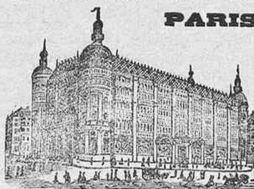
GRANDES ALMACENES DEL

Para más pormenores puede ocurrirse á las oficinas telegráficas del Estado.