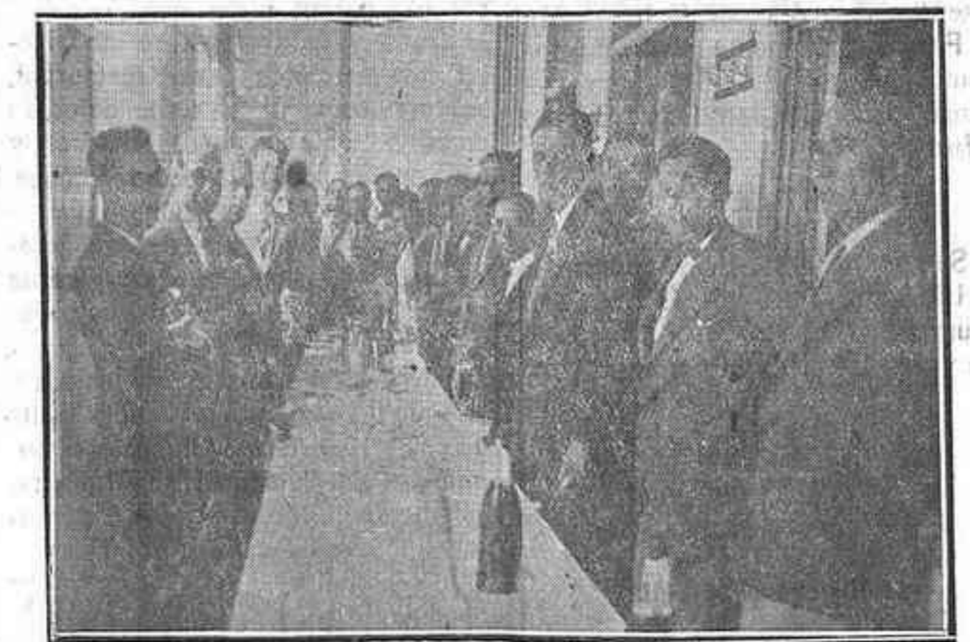
Grupo de invitados y socios que concurrieron al acto

Por primera vez, desde que el colombófilismo se practica en Canarias, hace más de treinta años, estas islas fueron incluidas en 1927-28 por la Federación Española en el concurso nacional que patrocinado por el Go-