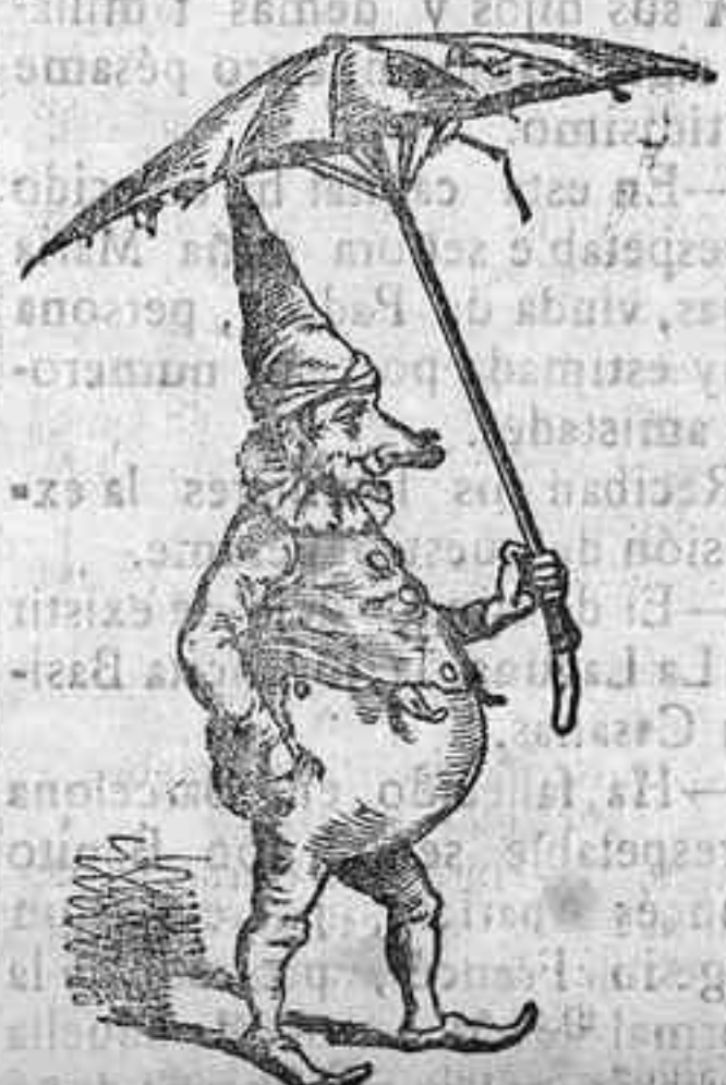
Los mayores triunfos de la temporada

OBSERVACIONES. —Esta Junta se ve precisada a poner en conocimiento de los señores socios que será expulsado de este Casino, el que presente como transeunte a personas que realmente no lo sean. Las señoras y señoritas que concurren a este baile, serán obsequiadas con una papeleta para la rifa de un artístico objeto. Se ruega encarecidamente a los señores socios no traigan al baile niños menores de trece años.