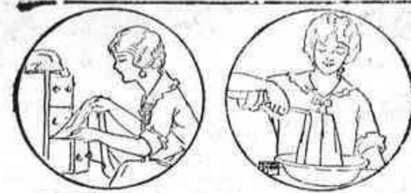
No desee sus blusas o vestidos cuando pierdan su color original

hechos de encargo. Crin vegetal y coti, a precios sumamente económicos, en la mueblería Bethencourt Alfonso (antes San José), número 18, accesoria.