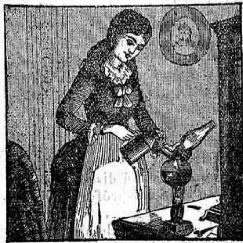
ACEITE PARA ALUMBRADO

Se realiza un lote de barriles de cerveza de dicha marca, recibidos por la casa HIJA DE J. GARCIA, San José, 16, al precio de VEINTE PESETAS el barril de 4 docenas de botellas.