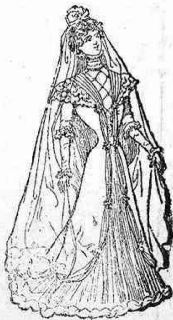
TRAJE DE BODA

Pocas modas hay en estos trajes, más atractivos y elegantes cuanto más sencillos. Este es el traje de nuestras ilusiones, y á veces pay el que las cierra y destruye. Podría decirse que todos los trajes que nos vestimos no son más que aderezos, aperitivos del traje supremo, del traje de boda. ¡Quién supiera escribir!, expresar con palabras sinceras y elocuentes los mil pensamientos que evoca en el mismo de quien lo contempla, un traje de bodal Para las muchachas cuyos sueños son siempre de color de rosa, que dulces anhelos, que agradables emociones despierta. Para las jóvenes que comienzan á dejar de ser o y aun no han hallado su felicidad ni el compañero de su vida, que andrugo azoramiento, que indefinidas miradas que parecen sondar el porvenir, arranca el vestido de novia. Para las madres de familia, que tropel de recuerdos, crueles á veces, felices otras, levanta la simbólica, halagadora toilette. Quiera Dios que la vistan pronto aquellas lectoras que aun permanezcan en soltería; y plugue al Cielo que nunca la recuerden con tristeza ni melancolía.