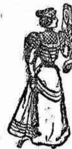
TRAJE DE CEREMONIA

Falda cortada en forma montada á usanza campesina, sobre los lados y detrás. Cuerpo plegado, recubierto con un bolero de guipure con delanteros que descienden formando caídas á lo largo