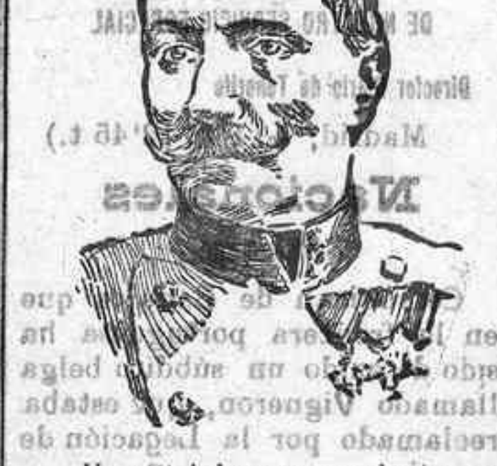
Von Steinberg comandante de la 14.ª división de caballería austro-húngara