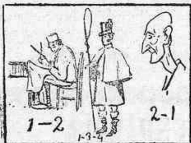
La solución, mañana.