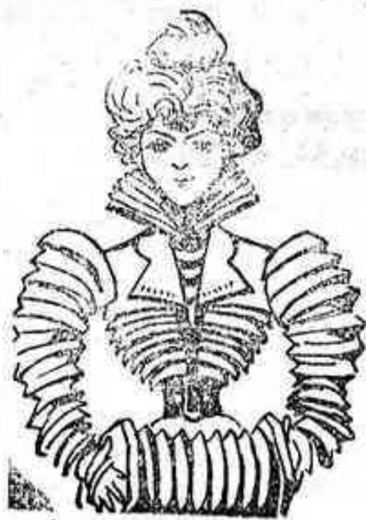
La mujer musical (última moda).

Precios de suscripción: 1.ª edición, el periódico solo, Madrid, un año, 6 pesetas; segunda edición, el periódico con tres labores al año, 12 pesetas; tercera edición, el periódico con seis labores al año, 18 pesetas; cuarta edición, el periódico con doce labores, una en cada número, 30 pesetas; en provincias, 7, 14, 21 y 35 pesetas respectivamente.