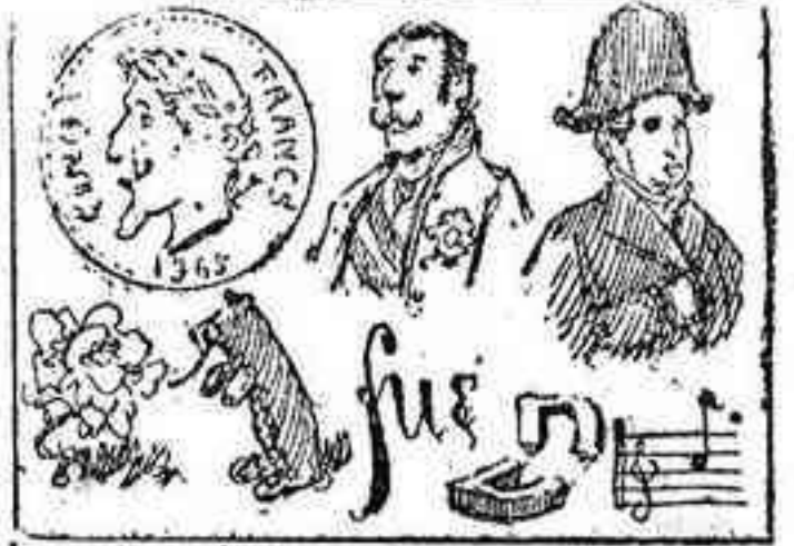
La solución, mañana.