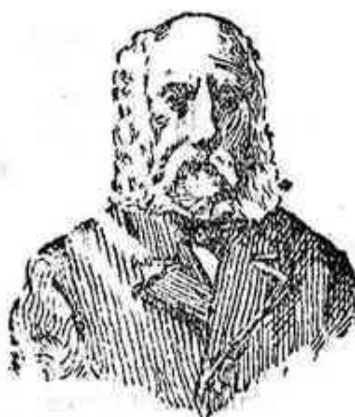
A. Charles Lambert PARIS Depósito General Calle Balmes, 106 Barcelona.

IMPRENTA ISLEÑA DE HIJOS DE F. C. HERNÁNDEZ Calle de Valcútin Sanz, núm. 8