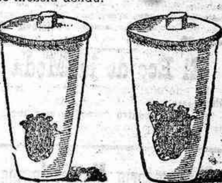
Crisoles. Por lo regular, y para mayor esmero en el trabajo, Lemoine empleaba dos crisoles: el señalado en nuestro dibujo con la letra A cuando la cristalización se derramaba por la masa entera, y el de la letra B, cuando, por el contrario, los diamantes se hallaban en la base.

Colocada esta mezcla en un crisol, métese éste en el horno eléctrico y antes de hacer obrar la corriente, hacia pasar por el crisol ácido carbónico para arrastrar todo el oxígeno. Enseguida calentaba el horno, sin dejar de hacer pasar ácido carbónico por la mezcla. El tiempo de calefacción dependía de la cantidad de mezcla usada.