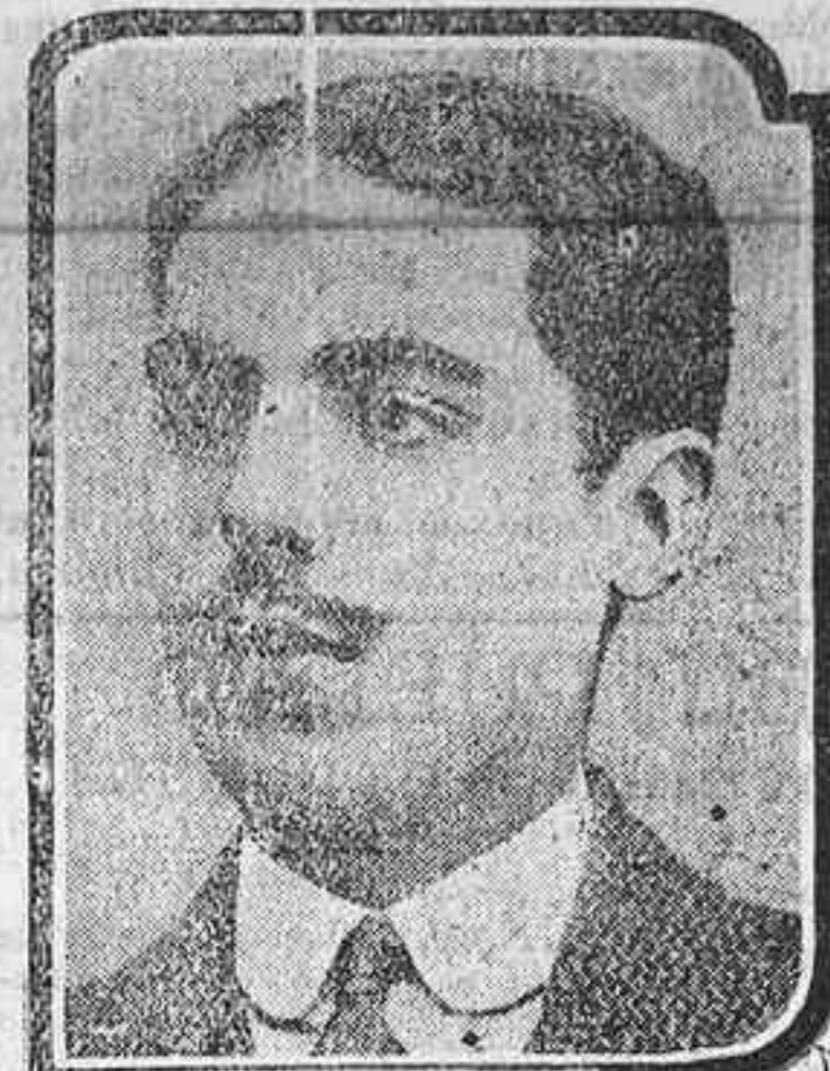
D. J. MECA. El Rodrigo

Sí, por desgracia vuestra, padecierais alguna de esas numerosas enfermedades que tienen por origen la pobreza de sangre ó la debilidad del sistema nervioso, entonces no padecerais, sin necesidad por más tiempo: empezad, desde hoy mismo, á tomar las Píldoras Pink, que regenerarán vuestra empobrecida sangre, tonificarán vuestro sistema nervioso y os curarán.