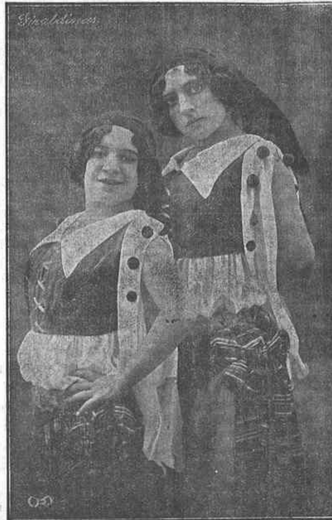
LAS GIRALDINAS duetto femenino que esta noche se presenta al público en aquel teatro.