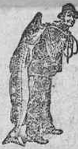
Obtengase siempre la Emulsión en su marca del pez.

La Emulsión SCOTT es la Emulsión original y el remedio modelo para todas las enfermedades de la garganta, pulmones, piel, sangre, y huesos. Las demás emulsiones, siendo imitaciones de la de SCOTT, no pueden dar más que desengaños.