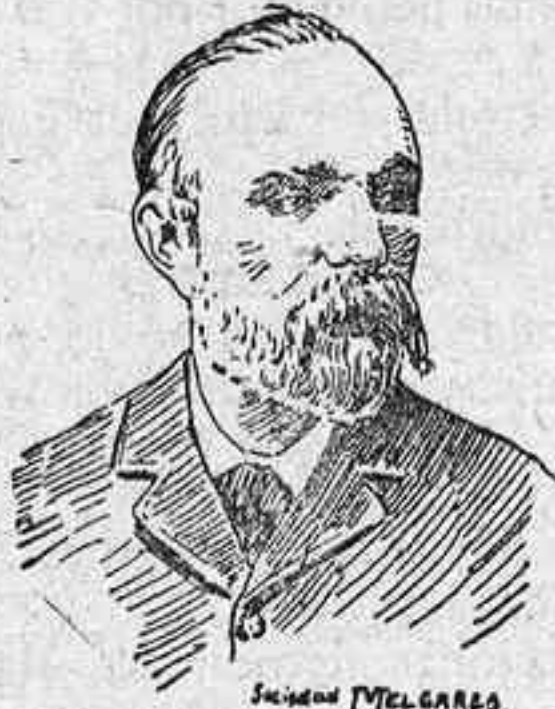
M. Paul Brouardel

A Brouardel se debe principalmente el impulso que han tomado los estudios higiénicos y sus infinitas aplicaciones al mejoramiento de la vida urbana. Ya antes de mo-