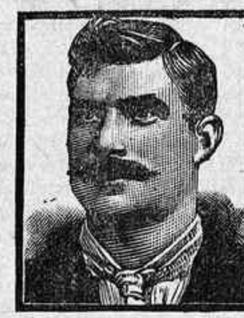
TARRASA, Calle Media Pasca 46, 8 Marzo 1908.

También entró ayer el precioso yate de recreo inglés Vanadis que viene de Southampton, Brest, Coruña, Lisboa y Funchal.