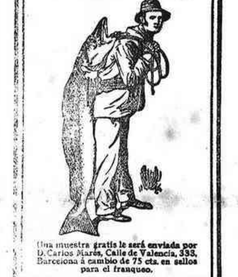
Esta es la "EMULSION SCOTT" legitima que se fabrica en Barcelona...