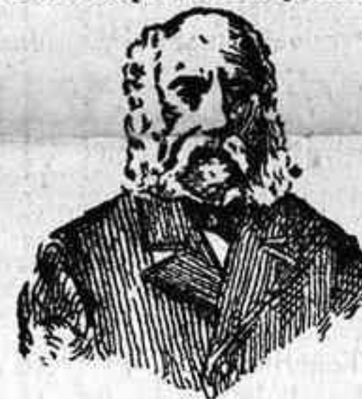
A. Charles Lambert.—París Depósito general Calle Balmes número 106 su estado normal, libre de todo virus, dando salud é inmunidad para evitar la reproducción de tan terrible enfermedad.

El eminente doctor Charles Lambert, de París después de un profundo estudio sobre las enfermedades venéreas y sífilíticas ha encontrado el medio de curarlas radicalmente, no solo sin hacer uso del MERCURIO, sino que combate las enfermedades contraídas por el uso de dicha sustancia. El tratamiento es sencillísimo y las fórmulas son puramente vegetales, pues en su composición solo entran hierbas minerales de la India. Estas fórmulas las presenta en las formas siguientes: Las Píldoras Charles Lambert, que curan las purgaciones, estrecheces de la uretra, flujo blanco de la muger, y gota militar. La Inyección Charles Lambert, que debe de usarse al mismo tiempo que las píldoras para que la curación sea más radical y pronta. El Elixir Charles Lambert es un gran medicamento, eficazísimo para la completa destrucción de todo bacilo sífilítico. Con su uso se purifica la sangre impura, dejándola en su estado normal, libre de todo virus, dando salud é inmunidad para evitar la reproducción de tan terrible enfermedad. Este Elixir debe de tomarse como complemento del tratamiento, una vez que los efectos, ó sea la purgación, haya desaparecido.