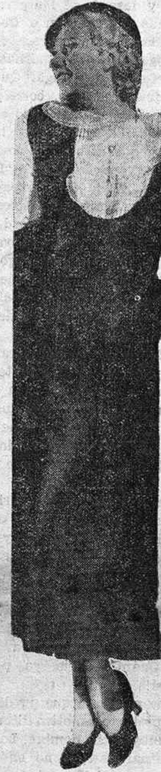
La eternamente rubia Jean Harlow

en Religión y pueda comenzar a cumplirse para él esa vida de renuncia y obediencia a que le lleva una irresistible vocación.