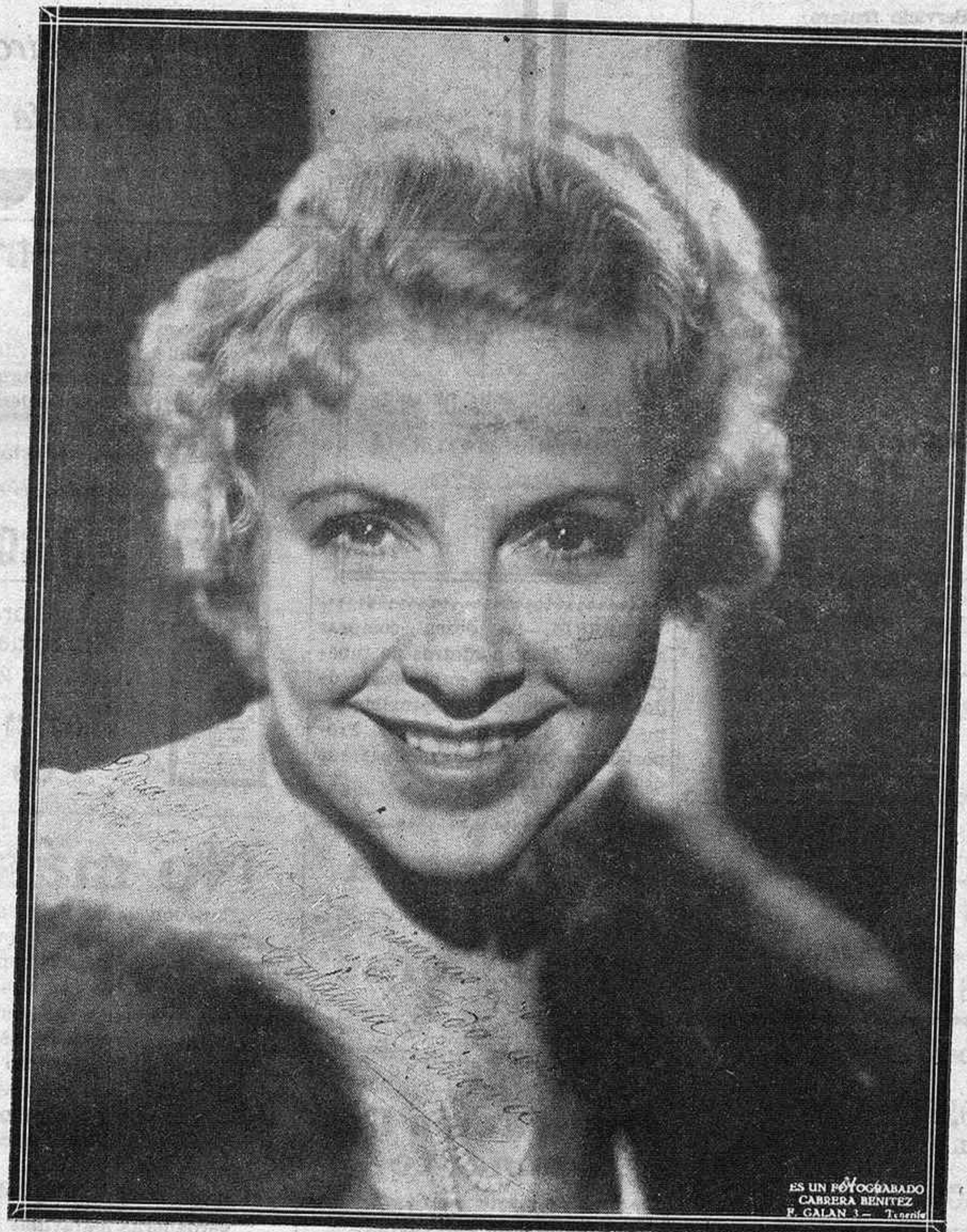
CATALINA BARCENA, UNO DE LOS MAS GLORIOSOS PRESTIGIOS ARTISTICOS DE LA ESCENA ESPAÑOLA CONTEMPORANEA Y DEL CINEMA MUNDIAL

ha anunciado la cancelación de un contrato que tenía para bailar una de sus danzas, y afirma que dicha cancelación es debida a haber sido contratada también para la Feria Internacional de Chicago.