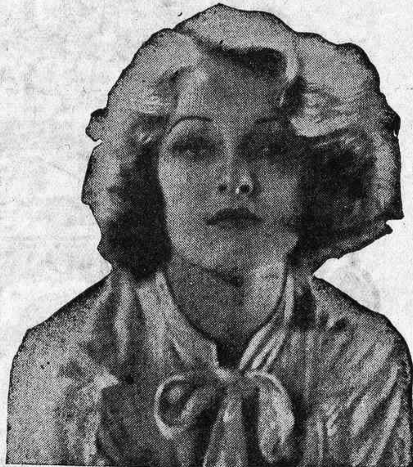
He aquí a esta jovencita, con su aire tímido, pero descubriéndonos la personalidad de Gwile André, una de las "estrellas" del cinema de más sólido prestigio allá en Hollywood.