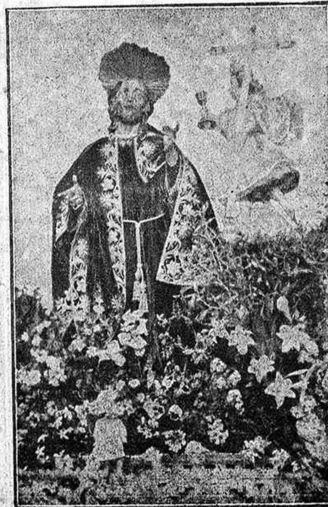
Imagen del Señor del Huerto, a la que el Lunes Santo se le dedican espléndidos cultos en la capilla de la Venerable Orden Tercera, de Santa Cruz de Tenerife, que este año han constituido una grandiosa manifestación de religiosidad.

Podér. Que son esos los motivos fundamentales de la religiofobia dominante, me lo enseñan mis profundos conocimientos de la psicología humana, estando dispuesto a apostar diez contra uno a quien se atreva a desmentirme.