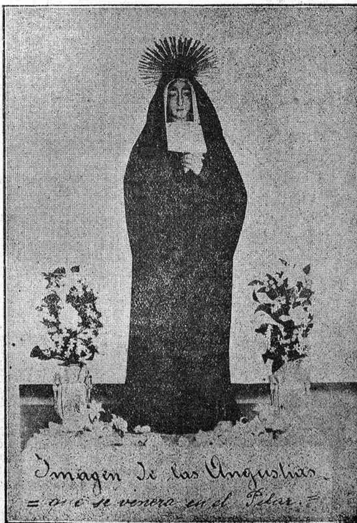
Imagen de las Angustias = a i se venera en el Pilar =

La milagrosa Imagen de la Virgen de las Angustias, que se venera en la iglesia del Pilar, de esta capital. A los cultos que mañana, Viernes Santo, se celebrarán en su honor en el expresado templo, será verdaderamente extraordinaria la concurrencia de fieles que asista.