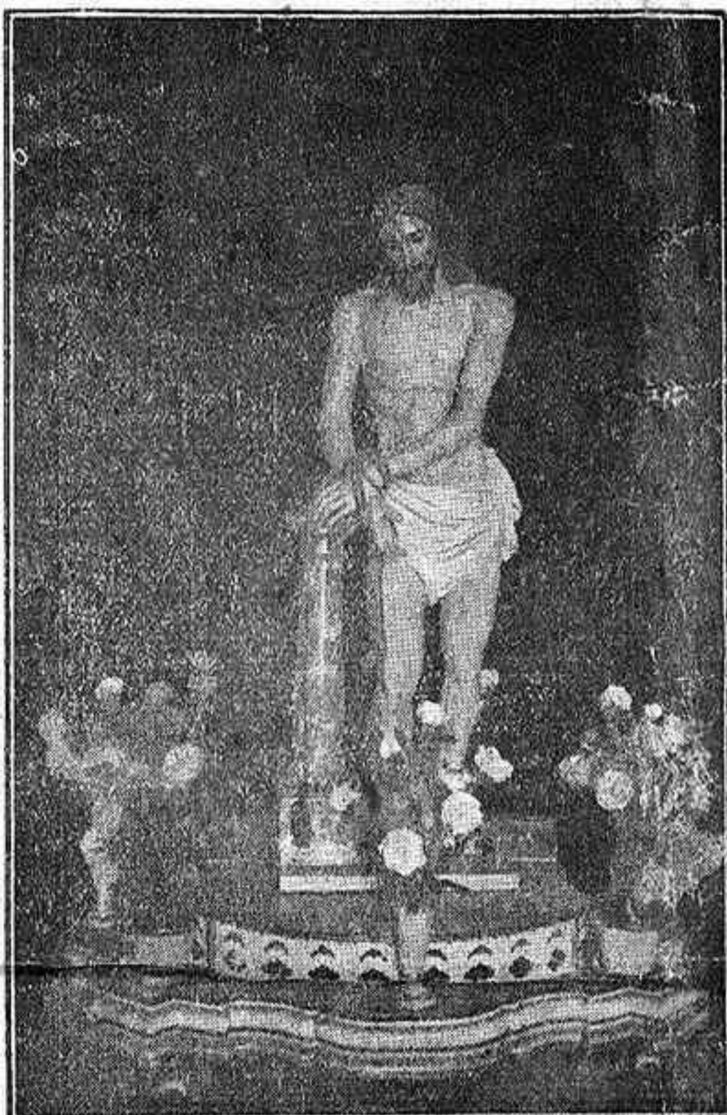
El Cristo a la Columna que se venera en la iglesia del convento de San Francisco, de la villa de Garachico, y sale en procesión, suntuosamente, el Miércoles Santo.

¡Acérquense los hombres todos a la Iglesia Católica, que es la legítima re-