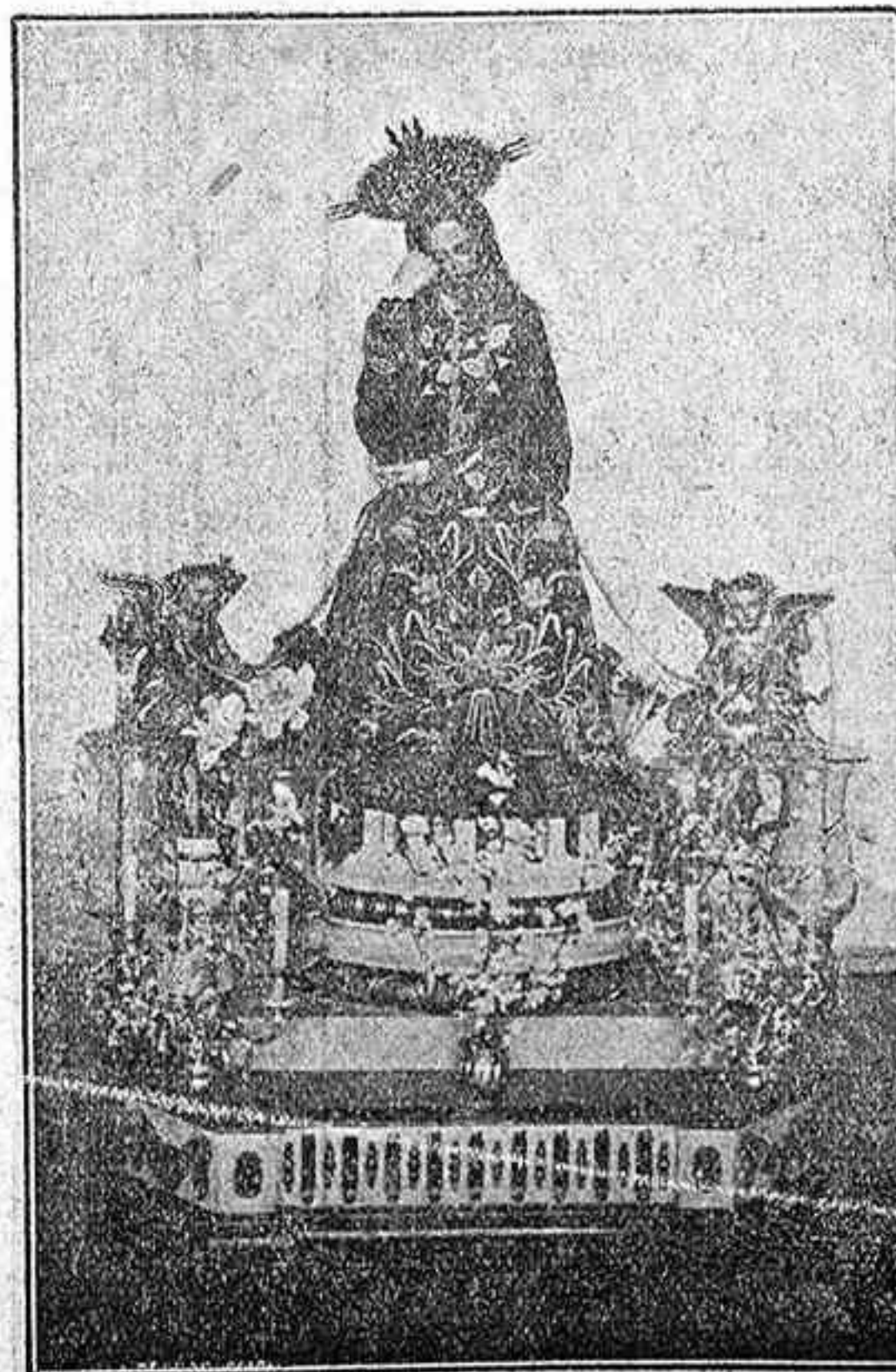
Imagen del Gran Poder de Dios, que con gran devoción se venera en el Puerto de la Cruz