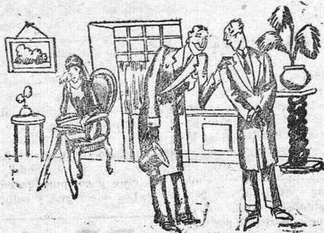
—¿No cree usted que esa señora tiene un dolor muy grande para un pañuelo tan pequeño?

en la Cuesta, de construcción moderna, y a 20 metros de la carretera, compuesta de zaguán, hall, sala, cinco dormitorios, comedor, cocina, cuarto de baño, 2 W. C., 2 patios, jardín y huerta, se VENDE o se CAMBIA por otra de esta capital.—Razón, Teobaldo Pówer, 28.