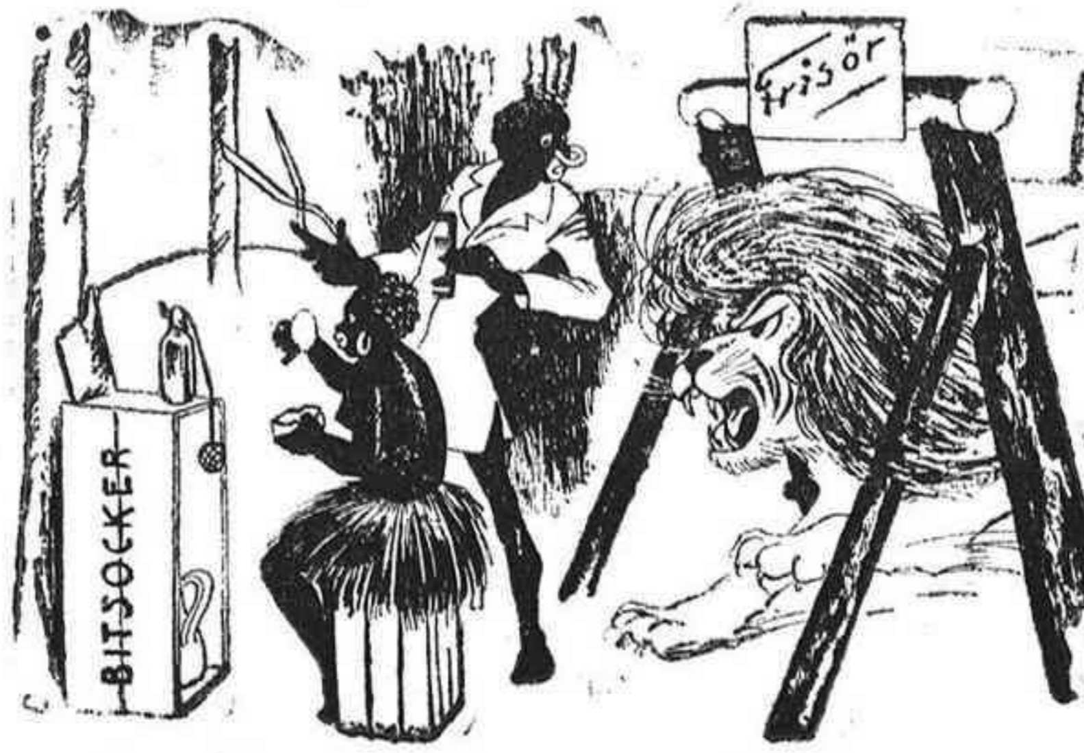
El barbero distraído de Liberia.—¿Qué es lo que desea el señor? ¿Cortarse el pelo?...

un salón amplio para oficina.—Daran razón: Gran Café Cervantes.