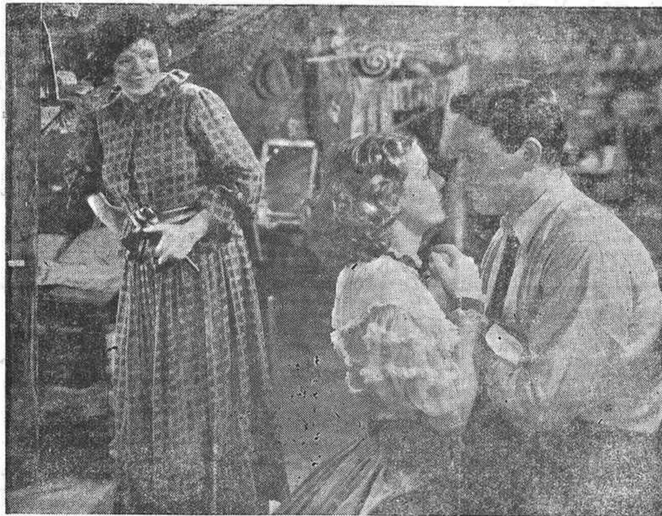
Spencer Tracy y Loretta Young en uno de los momentos de la producción Columbia "Fueros humanos", que distribuye CIFESA en la presente temporada.

Los concursantes de provincias deberán incluir, al solicitar la devolución, los sellos para el franqueo.