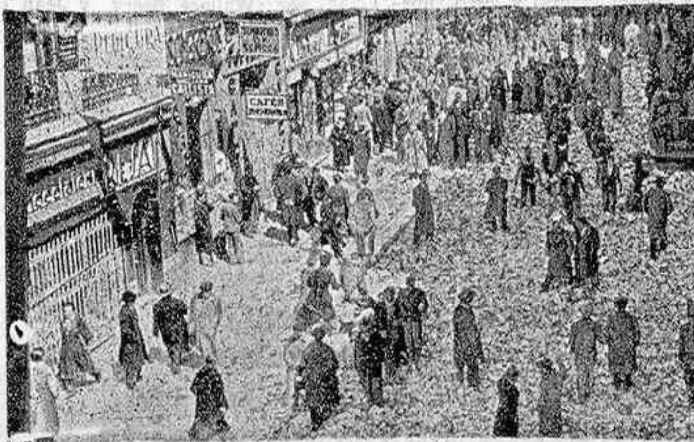
En la parada huelga de 24 horas en Madrid, como protesta por los sucesos fascistas, la carga de varios millones de "A B C" que llevaban unos camiones fué destruída. He aquí el aspecto de una calle con el piso totalmente cubierto por los papeles.