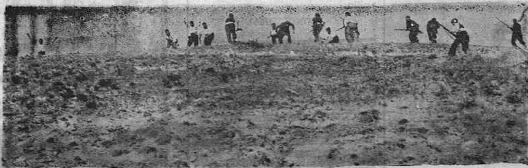
FOTOGRAFIA TOMADA EN PLENO ATAQUE DE LOS NACIONALISTAS A UNA POSICION MARXISTA EN SOMOSIERRA, EN LA QUE LOS FALANGISTAS CORONARON VICTORIOSOS LA POSICION.

Los momentos son verdaderamente emocionantes. El interés crece. En los días que restan de mes y antes de que el cierzo azote las faldas del Guadarrama, Madrid se verá fieramente atacado por todas partes. Creemos que también por Levante, pues no tardará en aparecer por aquel llanazo una fuerte columna que corte las comunicaciones con Guena y Albacete. La magnífica aviación nacional se encargará de ir anunciando a los rojos engañados lo que les espera. Observemos atentamente los movimientos, pues la hora del triunfo definitivo se acerca.