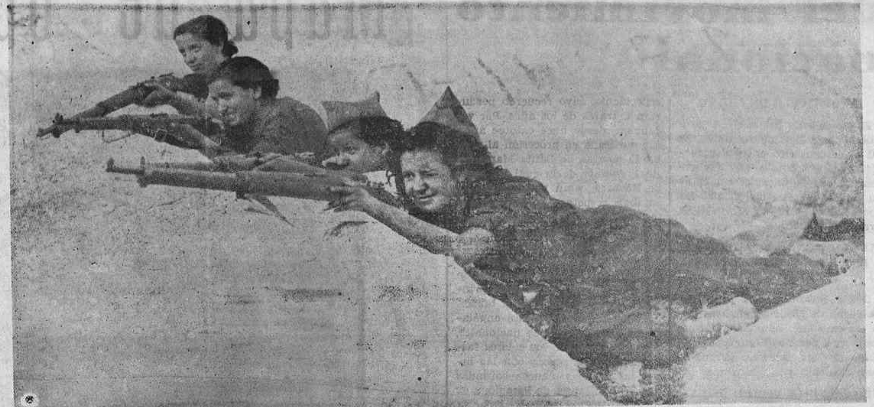
HE AQUI UN GRUPO DE MUCHACHAS EN EL PAROXISMO CARNAVALESKO DE LA FOBIA COMUNISTA. ¡POBRES CRIATURAS ENLOQUECIDAS POR LOS INCENTIVOS Y LOS INSTINTOS FEROCES!...

Termina diciendo el periódico que la libertad del ex-jefe de las cábilas del Rif arroja una nueva luz muy característica sobre la colaboración entre Madrid, París y Moscú.