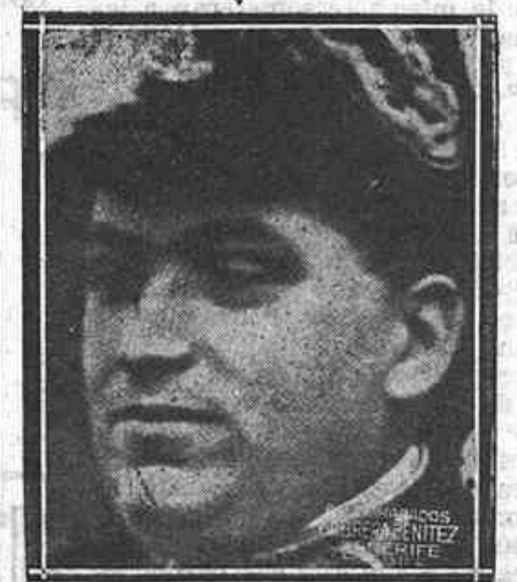
EL SR. CALVO SOTELO CON EL UNIFORME DE MINISTRO

Como a pocos hombres—ha dicho Pemán—, le deparó la Providencia las circunstancias necesarias para prepararse a ser un hombre de Gobierno. Cursó todas las técnicas y las emociones para ello necesarias. Pasó su inteligencia capaz y ávida por todos los medios para ello convenientes. Primero, como diputado maurista, como gobernador civil, el fogueo bisoño de la política en su más baja y mecánica acepción. Luego, en la elaboración del Estado, el contacto con la vida municipal; luego, el contacto pleno con la vida nacional en el Ministerio de más total y ancha intervención. Luego, el austero noviciado para el sacrificio, la tremenda recapitulación y examen de conciencia del destierro de aquel destierro, jugoso, maduro, fértil en crónicas tan llenas de realidades españolas, que nos hacían pensar que nosotros, y no él, éramos los desterrados.