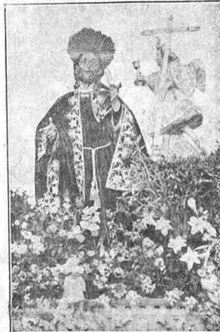
Imagen del Señor del Huerto, que ayer, Lunes Santo, no salió procesionalmente, a causa de la lluvia, de la parroquia de San Francisco de Asís, de esta capital. Por tal motivo dicha procesión saldrá mañana, Miércoles Santo.