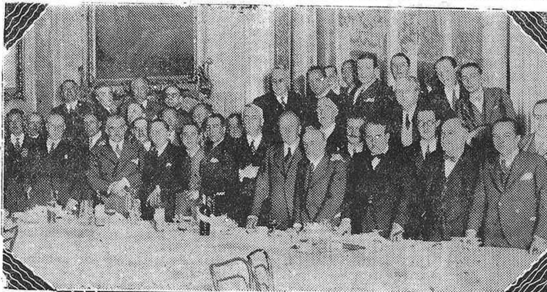
GRUPO DE CONCURRENTES AL BANQUETE ORGANIZADO EN MADRID POR LA C. E. A. PARA CELEBRAR LA INAUGURACION DE SUS TRABAJOS CINEMATOGRAFICOS, AL QUE ASISTIERON, AUTORES, COMPOSITORES, FINANCIEROS Y PERIODISTAS.