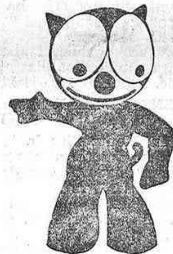
Fotografía A. BENITEZ San José, 23

Vean la colección Pepito, Moscas, Moquito, Micky, Gato Félix, Roenueces