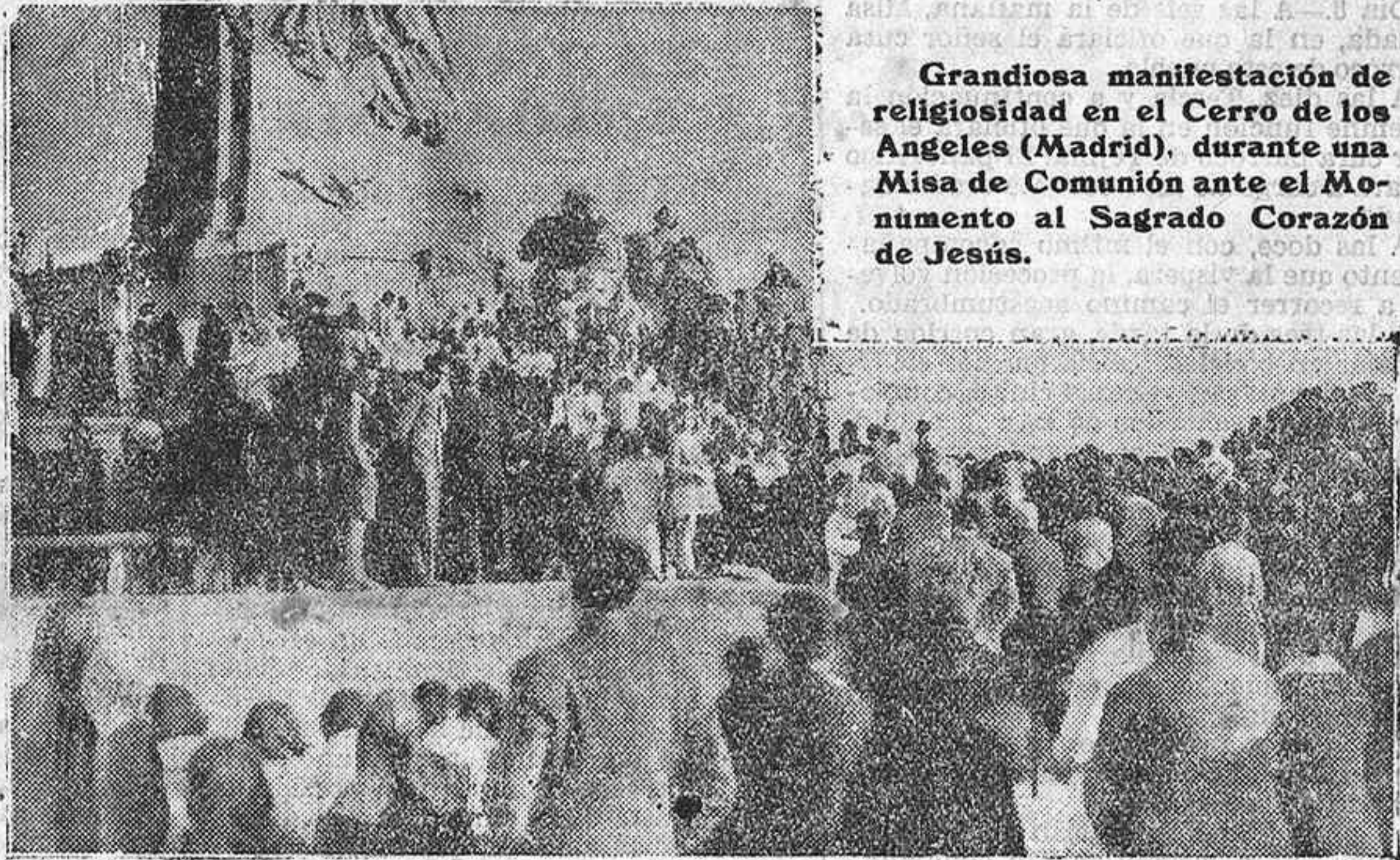
Grandiosa manifestación de religiosidad en el Cerro de los Angeles (Madrid), durante una Misa de Comunión ante el Monumento al Sagrado Corazón de Jesús.

Y, sin embargo, el problema es claro: lo que transforma la impresión o la acción espiritual a que el escritor se refiere es la parte moral del hombre. Nada más. Lo demás queda lo mismo. La gracia no destruye la naturaleza; la perfección, la eleva, la purifica; pero no la