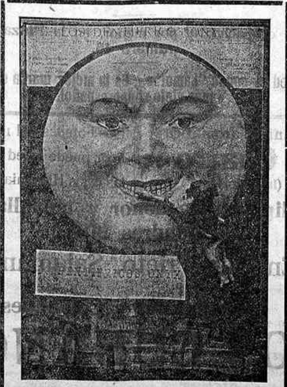
Jabón y Crema ONYX

¿Hay algo más desagradable y nocivo que una boca descuidada?