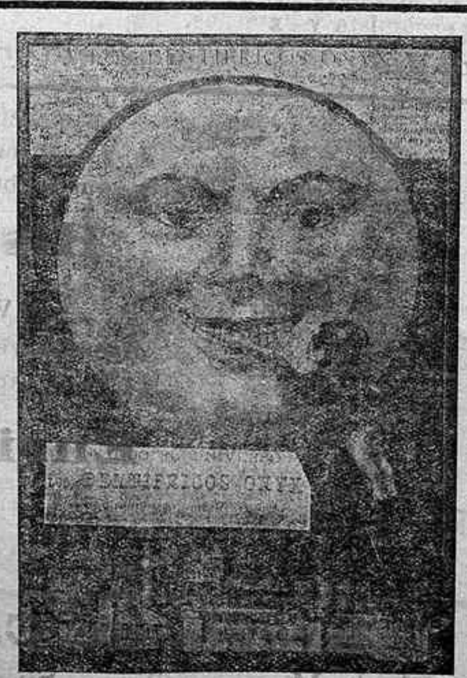
Jabón y Crema ONYX

¿Hay algo más desagradable y nocivo que una boca descuidada?