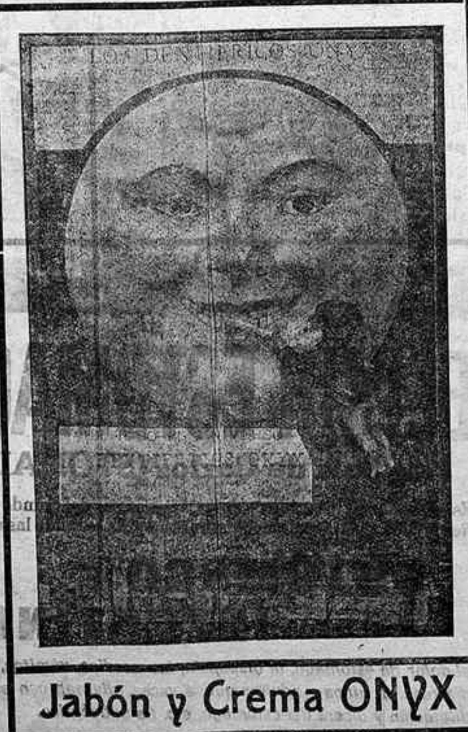
Jabón y Crema ONYX

¿Hay algo más desagradable y nocivo que una boca descuidada?