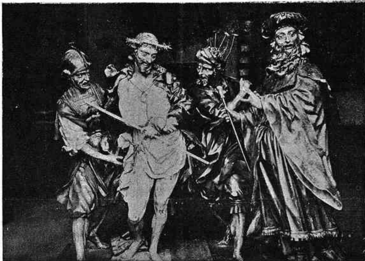
PASO LLAMADO DE LA CAÑA

lentísimo Sr. Obispo, rezando el Santo Rosario por las calles y se dirige á la Catedral Vieja y allí se hace el devoto Viacrucis.