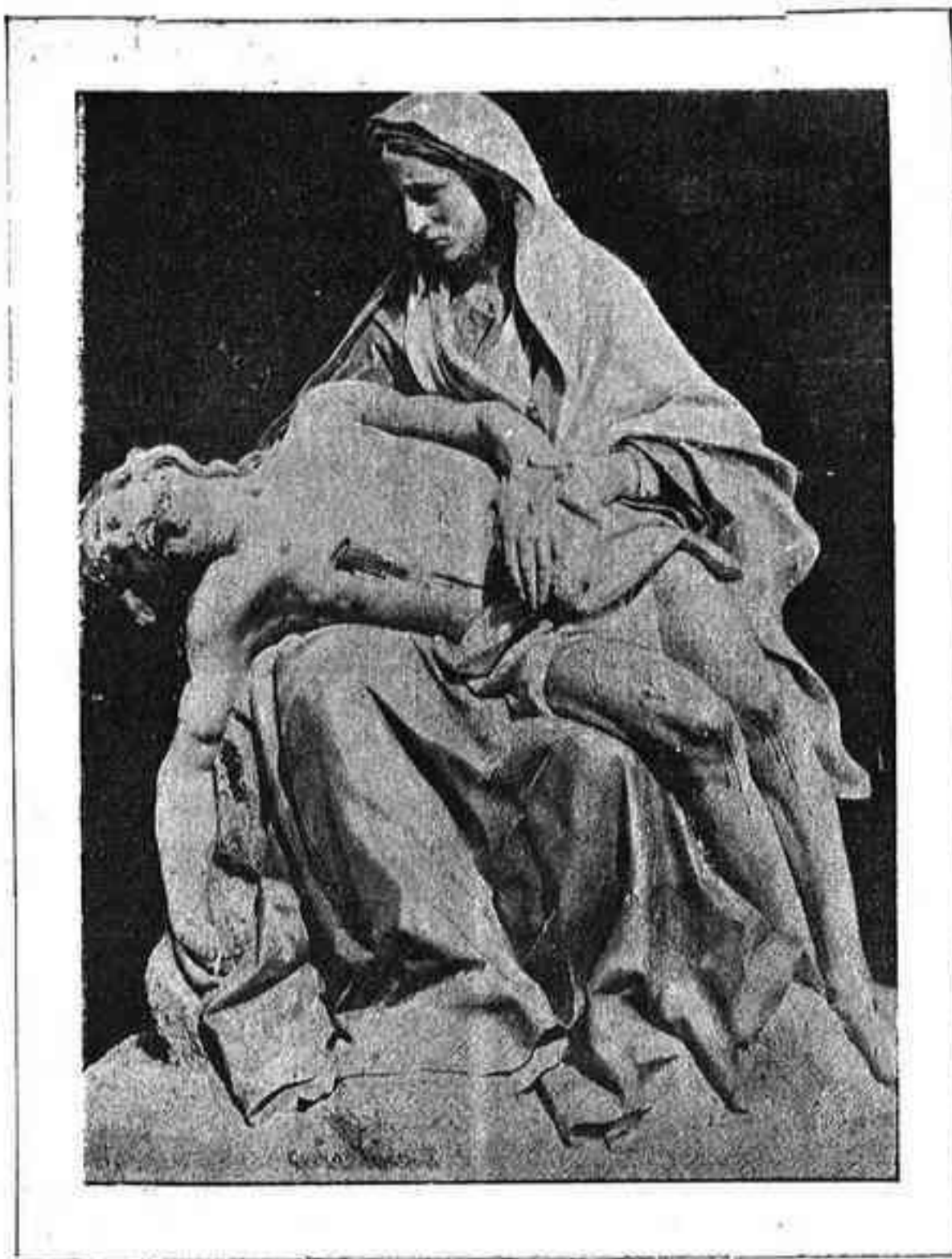
LA DOLOROSA DE LA CATEDRAL