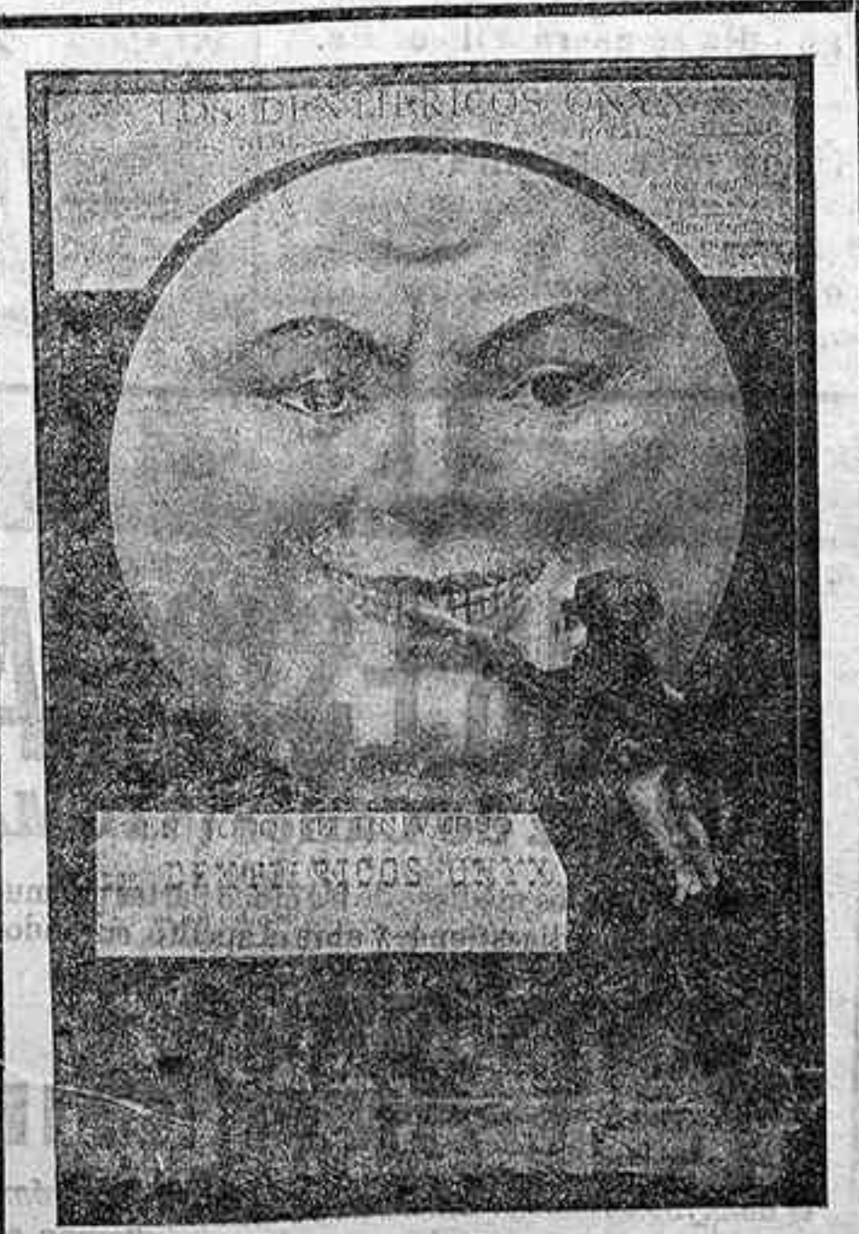
Jabón y Crema ONYX

¿Hay algo más desagradable y nocivo que una boca descuidada?