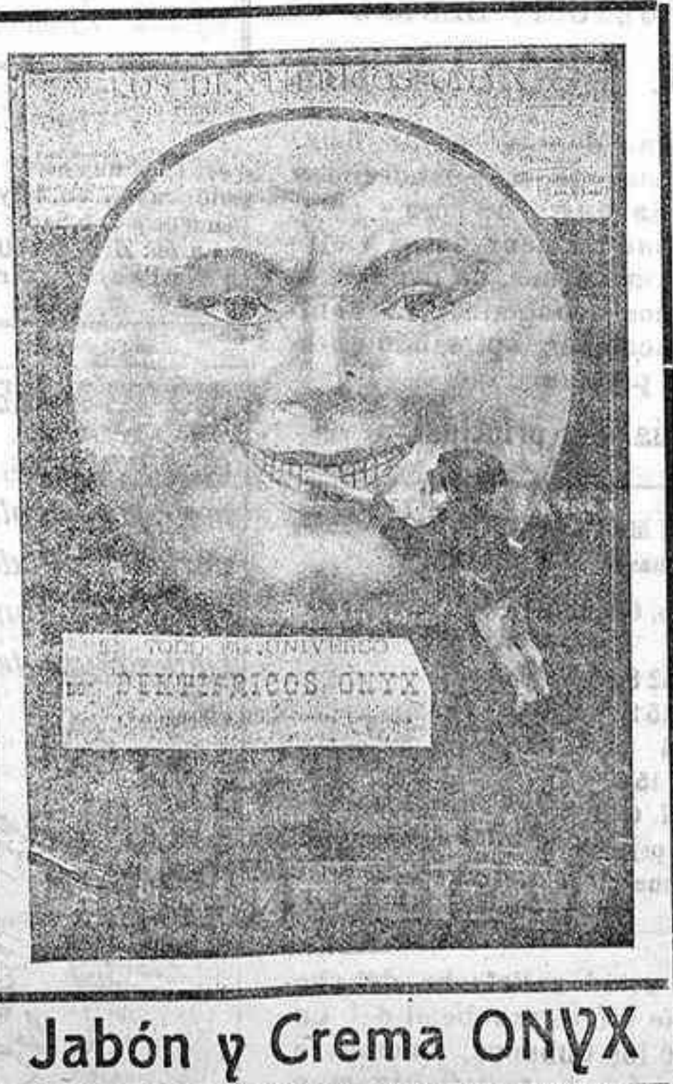
Jabón y Crema ONYX

¿Hay algo más desagradable y nocivo que una boca descuidada?