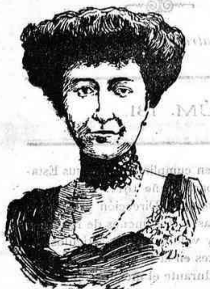
La princesa Clementina de Bélgica.

Nunca es tarde si la dicha es buena, suele decir el vulgo, y así pueden decir también el príncipe Víctor Napoleón y la princesa Clementina de Bélgica; por fin, dentro de brevísimos plazos, verán realizado su matrimonio, por ellos acordado hace más de una docena de años.