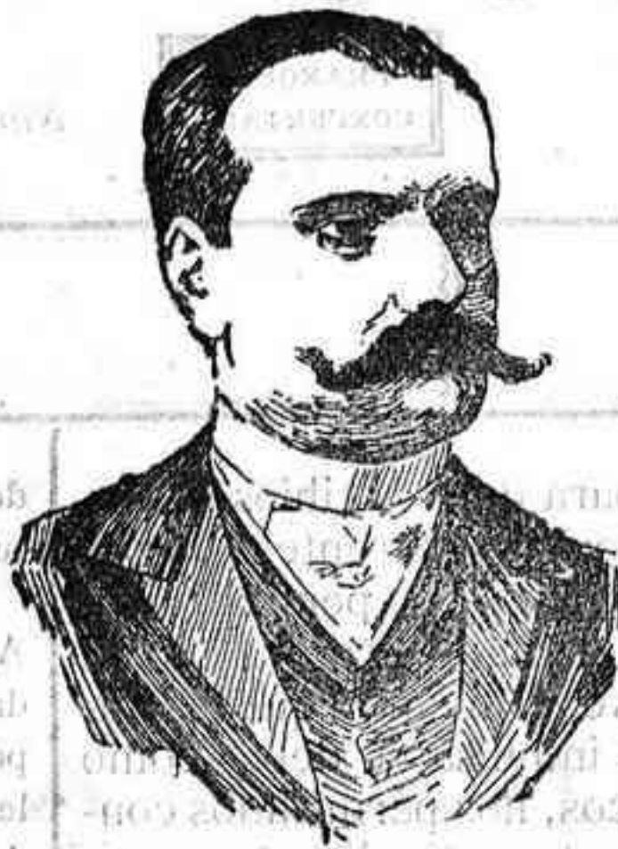
El príncipe Víctor Napoleón.

Leopoldo de Bélgica, pretextando motivos de carácter internacional, se opuso siempre al enlace de su hija con el descendiente del César francés, y la boda estuvo aplazada mientras vivió el rey de los belgas; pero una vez fallecido, el proyecto fué desempolvado, para llevarlo a la realidad tan pronto pasara el período de luto. El matrimonio tendrá efecto dentro de muy pocos días, en el palacio de Moncalieri (Milán), propiedad de la princesa Clotilde, madre del novio.