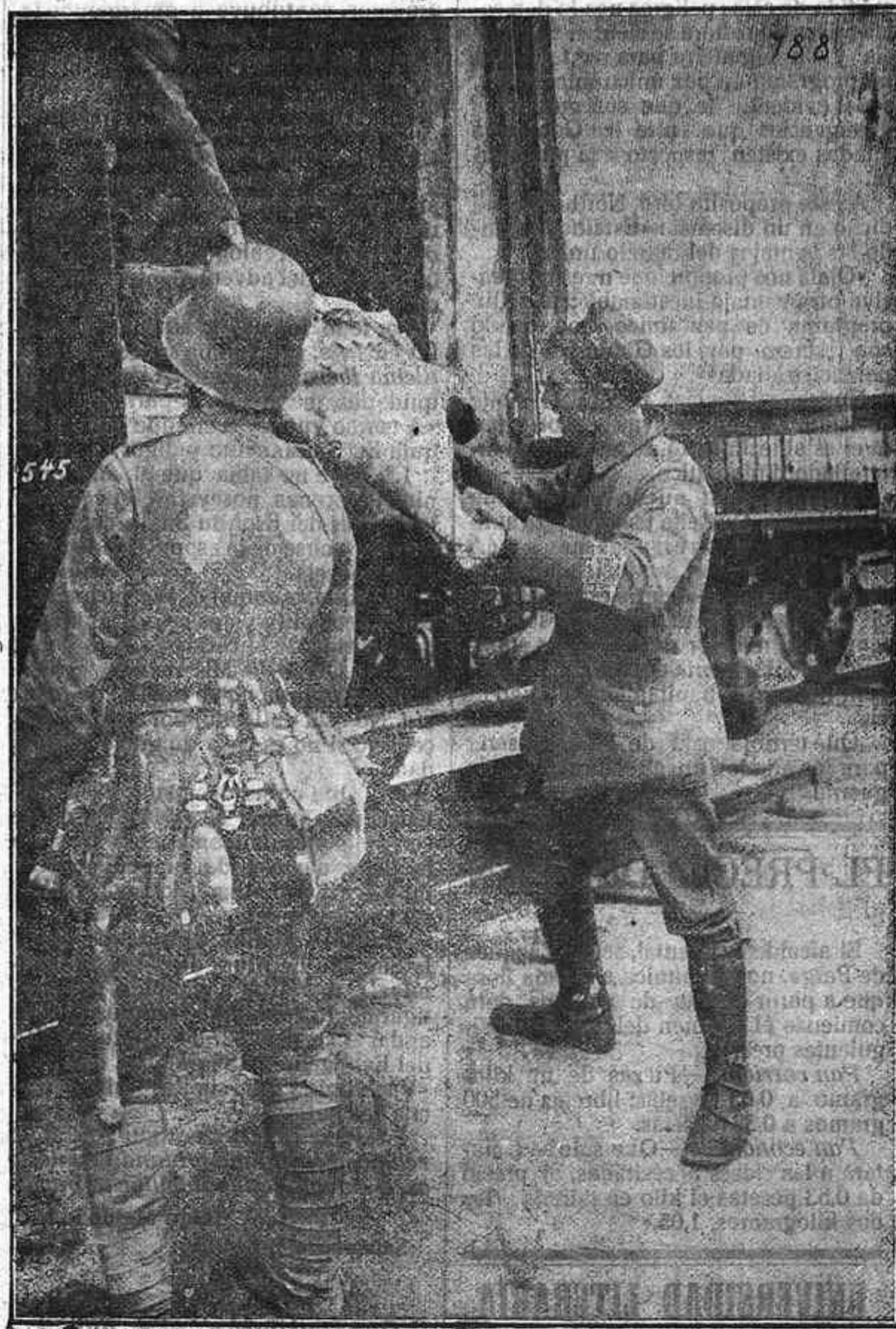
Soldados alemanes descargando carne congelada, para la sección de cocina, de un tren de provisiones capturado a los aliados.