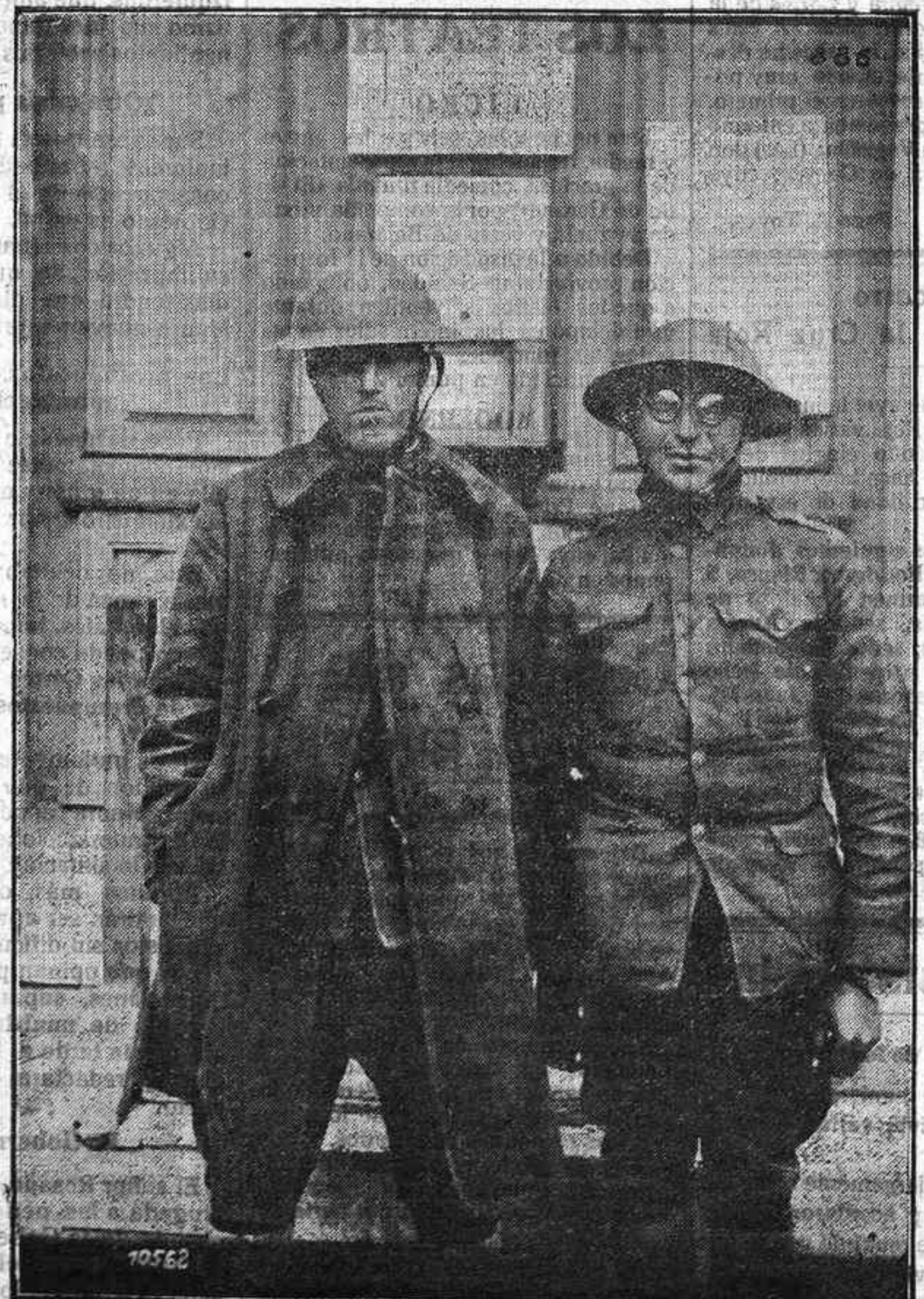
Tipos de prisioneros yanquis cogidos por los alemanes.