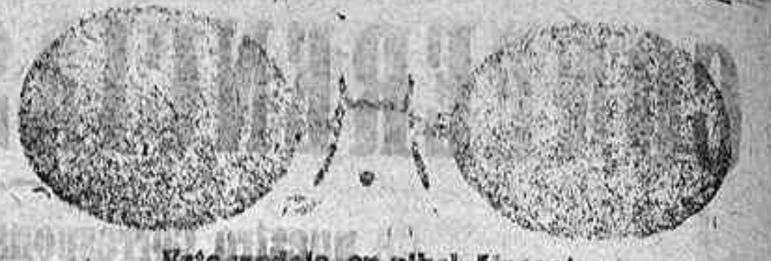
Este modelo, en níquel, 5 pesetas.

Gran surtido en relojes finos y corrientes, en ORO, DE SEÑORA Y CABALLERO; relojes de plata, acero y níquel, marcas escogidas; despertadores de bolsillo con esferas Radio, RELOJ, ORO DE LEY, en correa, para caballero (o señora), 40 pesetas; en níquel, 7. Lamentable surtido en toda clase de Gafas o Lentes, en oro, oro chapeado, níquel y concha; GAFAS O LENTE, oro chapeado, clase garantizada, con cristales graduados; a 12 pesetas; en níquel, 5. ESTUCHE PIEL, AMERICANO, 1,25 en relación de precio con los restantes. Se despachan recetas de los señores oculistas. Primera casa para instalaciones de Relojes de torre, dando grandes facilidades para los pagos.