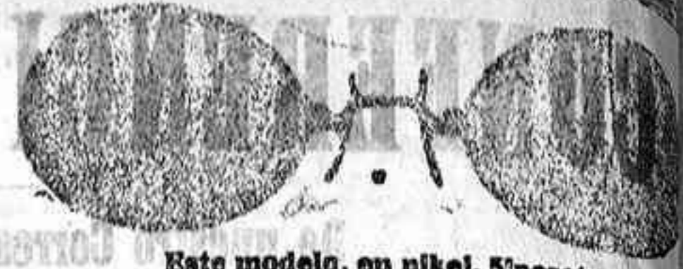
Este modelo, en níquel, 5 pesetas.

Gran surtido en relojes finos y corrientes, en ORO, DE SEÑORA Y CABALLERO; relojes de plata, acero y níquel, marcas escogidas; despertadores de bolsillo con esferas Radio. RELOJ ORO DE LEY, en correa, para caballero, señora, 40 pesetas; en níquel, 7. Inmenso surtido en toda clase de lentes, en oro, oro chapeado, níquel y concha; GAFAS ORO chapeado, clase garantizada, con cristales graduados, a 12 pesetas en níquel, 5. ESTUCHE PIEL, AMERICANO, 1,25 en relación de precios son los restantes. Se despachan recetas de los señores oculistas. Precios para instalaciones de Relojes de torre, dando grandes facilidades en los pagos.