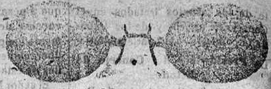
Este modelo, en níquel, 5 pesetas.

Gran Relojería y Óptica de Antonio Ferrelra Plaza Mayor, 40 (acera de Correos), Salamanca. Gran surtido en relojes finos y corrientes, en ORO, DE SEÑORA Y CABALLERO; relojes de plata, acero y níquel, marcas escogidas; despertadores de bolsillo con esferas Radio. RELOJ, ORO DE LEY, en correa, para caballero o señora, 40 pesetas; en níquel, 7. Inmenso surtido en toda clase de Gafas o Lentes, en oro, oro chapeado, níquel y concha; GAFA o LENTE, oro chapeado, clase garantizada, con cristales graduados, a 12 pesetas; en níquel, 5. ESTUCHE PIEL, AMERICANO, 1,25 en relación de precio son los restantes. Se despachan recetas de los señores oculistas. Primera casa para instalaciones de Relojes de torre, dando grandes facilidades por los pagos.