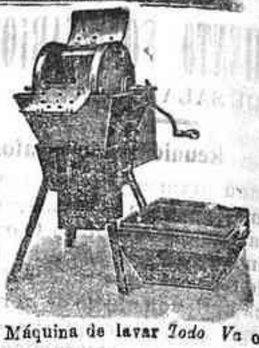
Máquina de lavar Todo Vapor

Rápidez, aseo, economía, higiene, economía de tiempo, jabón y ropa, pues ésta sufre menos que con el lavado ordinario.