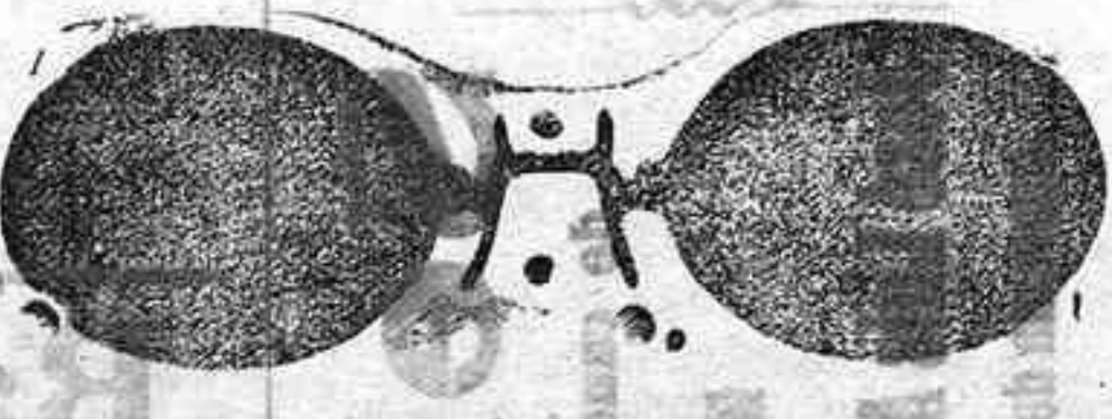
Este modelo, en níquel, 5 pesetas.

Plaza Mayor, 40 (acera de Correos), Salamanca. A pesar de la gran subida de la mayoría de los artículos, sigo vendiendo a los mismos precios. Gran surtido en relojes finos y corrientes, en ORO, DE SEÑORAY CABALLERO; relojes de plata, acero y níquel; marcas escogidas; despertadores de bolsillo con 'esteras Radio, RELOJ, ORO DE LEY, en correa, para caballero o señora, 40 pesetas; en níquel, 7.