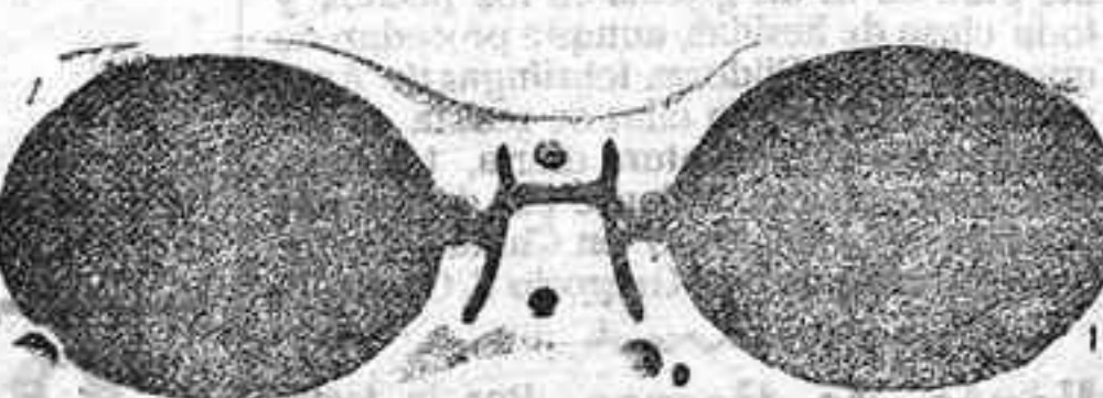
Este modelo, en níquel, 5 pesetas.

A pesar de la gran subida de la mayoría de los artículos, sigo vendiendo a los mismos precios. Gran surtido en relojes finos y corrientes, en ORO, DE SEÑORAY CABALLERO; relojes de plata, acero y níquel, marcas escogidas; despertadores de bolsillo con esferas Radio. RELOJ, ORO DE LEY, en correa, para caballero o señora, 40 pesetas; en níquel, 7.