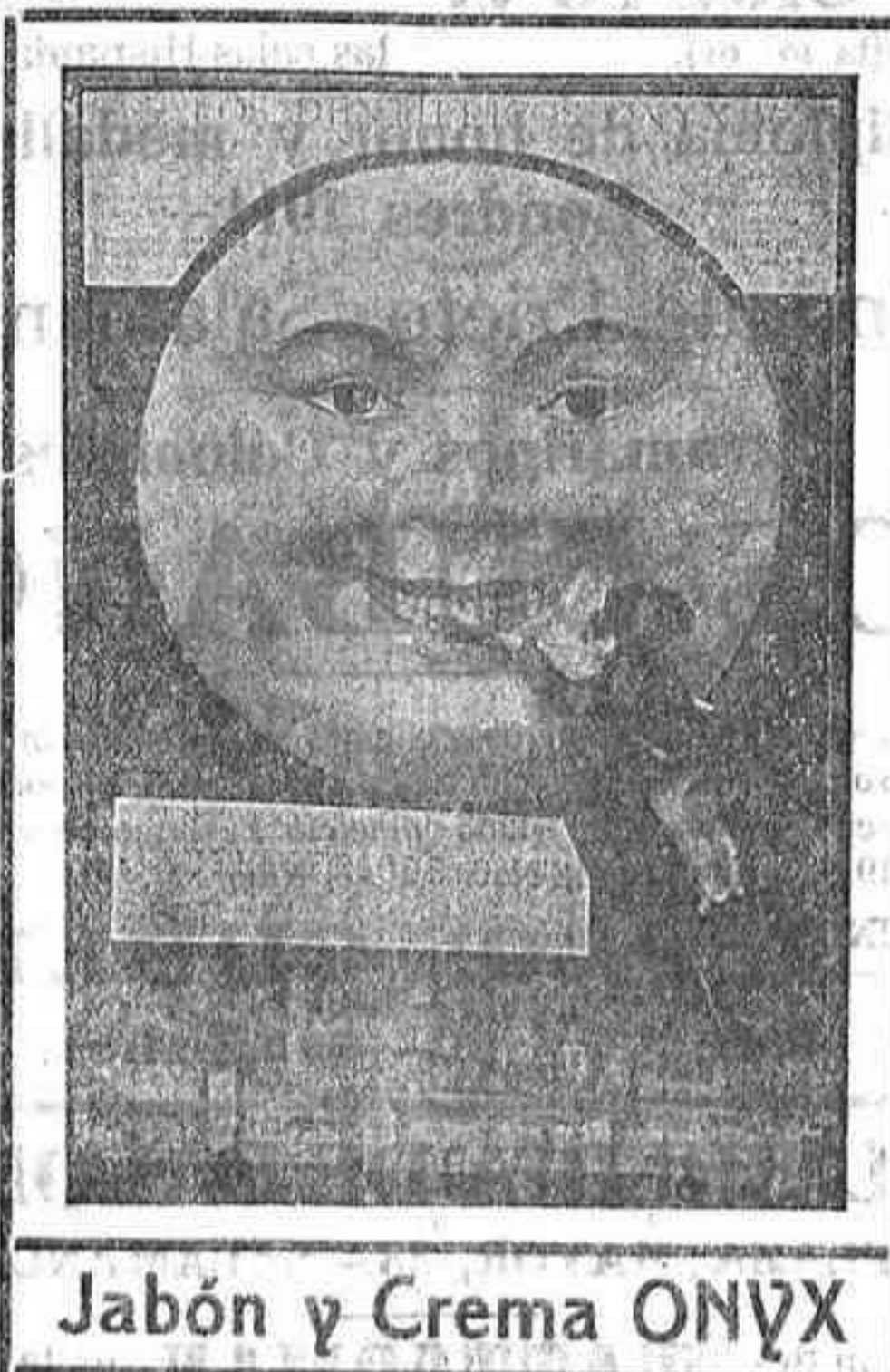
Jabón y Crema ONYX

¿Hay algo más desagradable y nocivo que una boca descuidada?