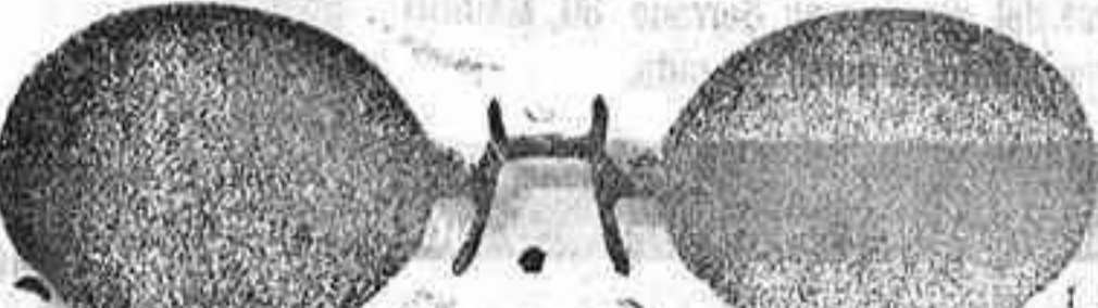
Este modelo, en níquel, 5 peseta

A pesar de la gran subida de la mayoría de los artículos, sigo vendiendo a los mismos precios. Gran surtido en relojes finos y corrientes, en ORO, DE SENORAY CABALLERO; relojes de plata, acero y níquel, marcas escogidas; despertadores de bolsillo con esferas Radio-RELOJ, ORO DE LEY, en correa, para caballero o señora, 40 pesetas; en níquel, 7.